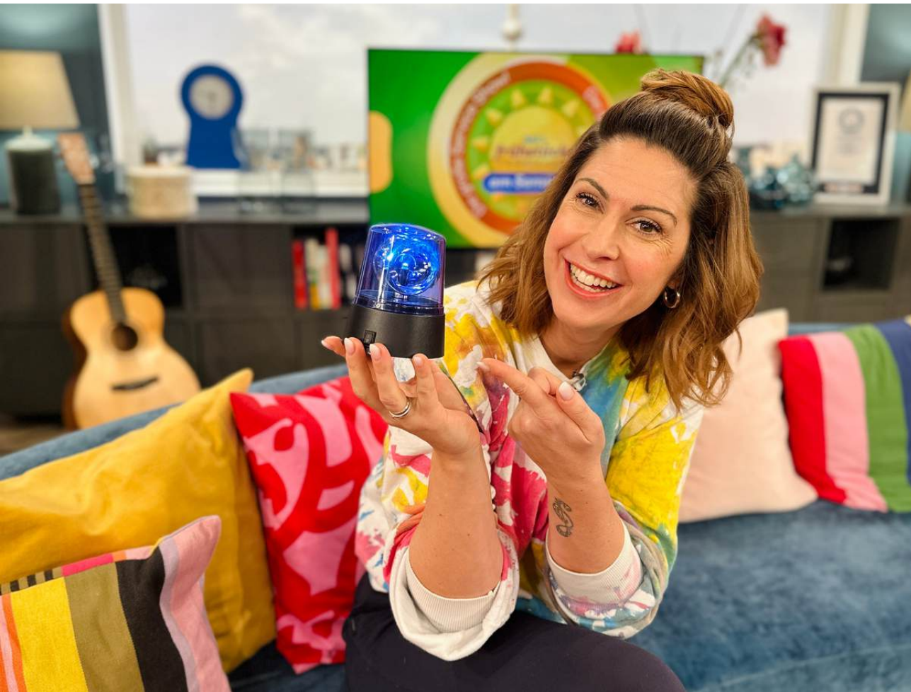
Sat.1 Frühstücksfernsehen 9.00 Uhr | Sat.1